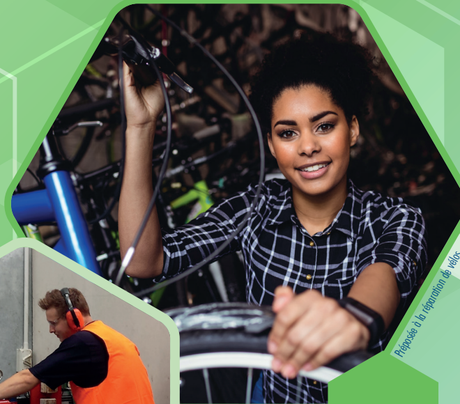
Préposé à la réparation de vélos