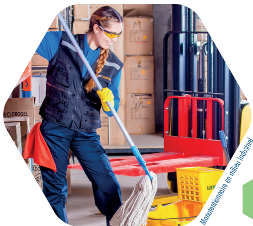
Maintenance en milieu industriel