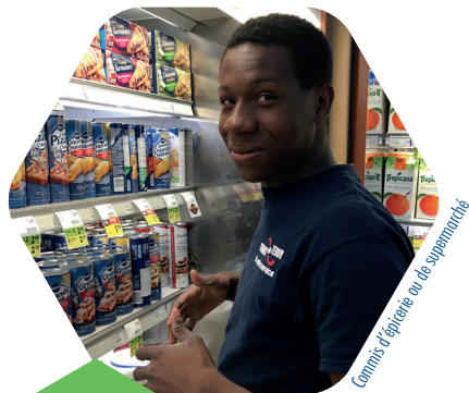
Camion d'épicerie au supermarché