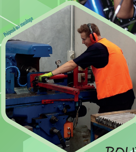
Préposé au meulage